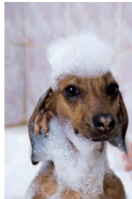
Avoir de la broue (mousse) dans le toupet.