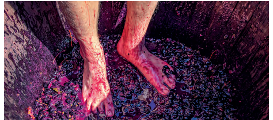
Être dans le jus